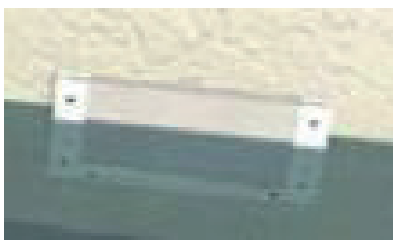
Couvercle d'entrée d'air limitant la pénétration de l'eau.