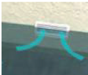
Situation initiale : l'eau pénètre par les entrées d'air.