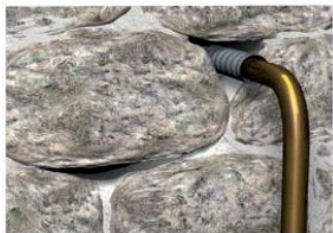
Situation initiale : passages possibles de l'eau à travers le mur.