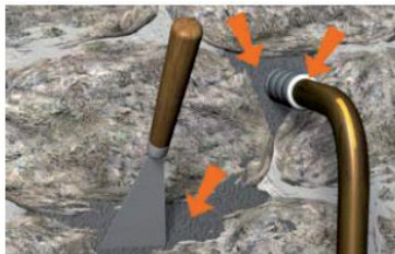
Situation après travaux : colmatage des voies d'eau.