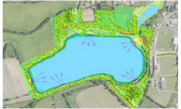
Vue aérienne de la carrière des Clouzeaux et projet d'aménagement – source dossier