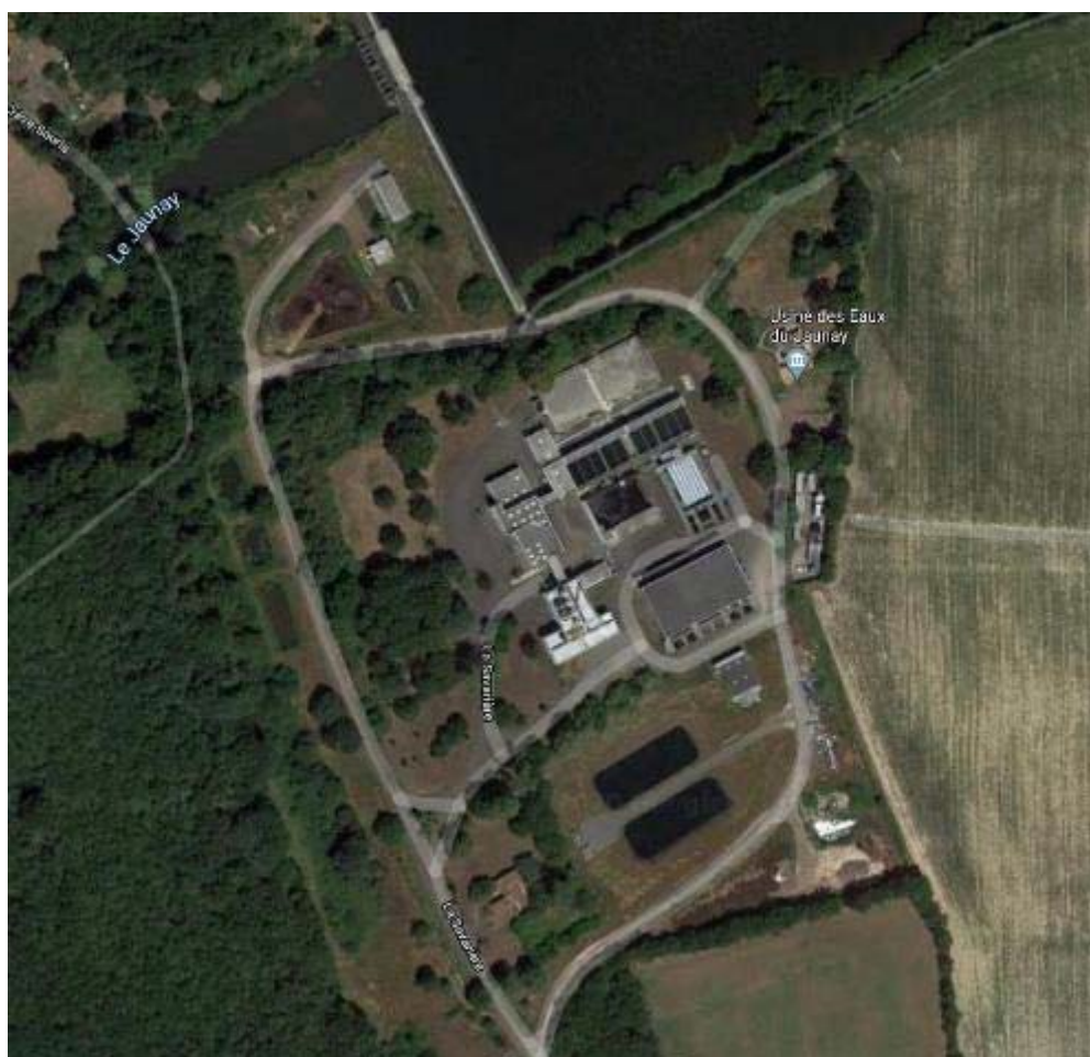
Vue aérienne du site de la station de traitement du Jaunay à proximité du barrage