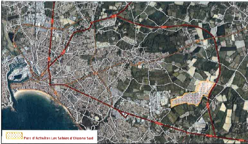
Localisation du projet d'ensemble dans la commune (Plan extrait du dossier)

entreprises, les autres étant en attente de commercialisation ou d'aménagement. L'aménagement d'une voie de liaison avec la route départementale RD 949 a fait l'objet d'un porter à connaissance au titre de la loi sur l'eau en 2018.