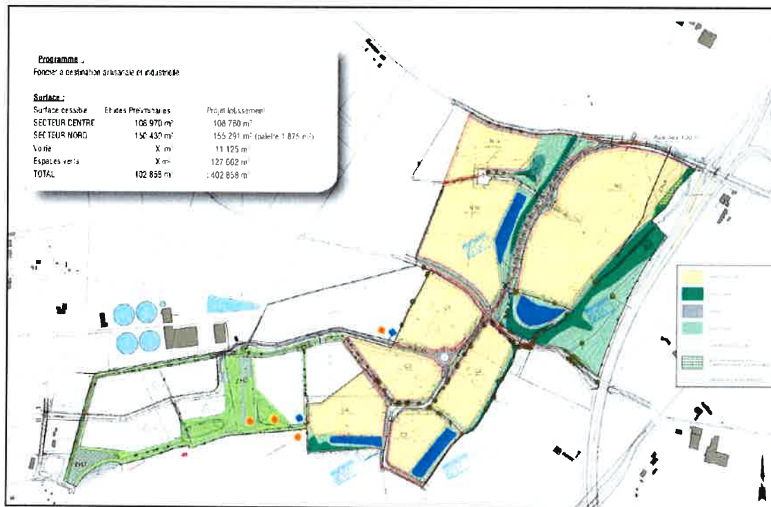
Projet d'aménagement retenu pour la seconde tranche (plan extrait du dossier)

ha) comprenant les bassins de rétention-régulation des eaux pluviales, la préservation des cours d'eau et zones humides et des corridors écologiques qui leur sont associés.