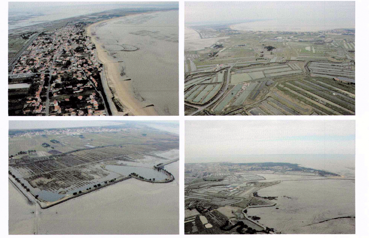
Île de Noirmoutier après le passage de Xynthia